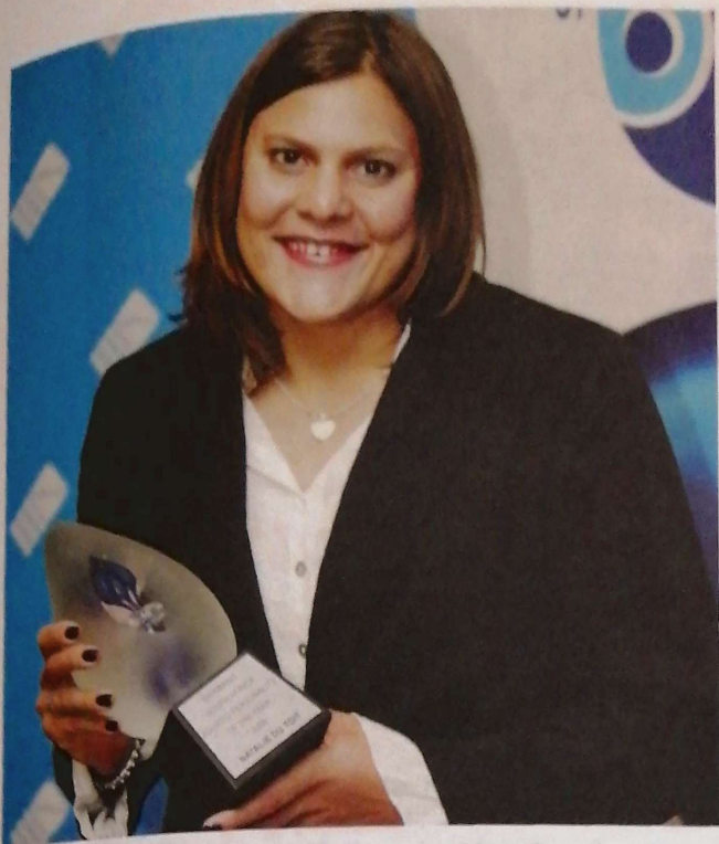
Natalie du Toit: Swemmer en motiveringspreker; het baie goue medaljes verower, onder andere by die Paralimpiese Spele van 2008; wenner van die Laureus Wêreldsportpersoon van die Jaar met 'n Gestremdheid (in 2010) omdat sy die grense tussen sport vir gestremdes en weerbare atlete afgebreek het.