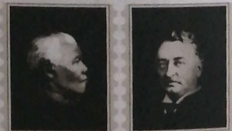
DIE MANDELA RHODES-STIGTING

Die Mandela Rhodes-stigting is 'n vennootskap tussen die Rhodes Trust en Nelson Mandela. Die stigting dra by tot leierskapontwikkeling in Afrika deur geleentehede vir tersiêre opleiding aan jongmense met leierskappotensiaal te verskaf.