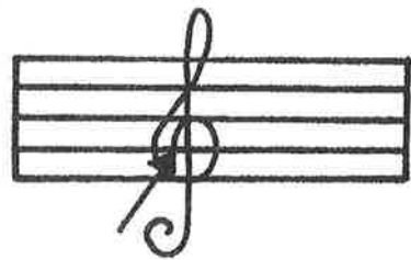
Die G-sleutel begin op die tweede reël

'n G-sleutel word in die diagram in die kantlyn aangetoon. Oefen om die G-sleutel te skryf.