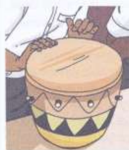
Die oop toon