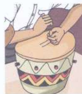
Die gedempte toon