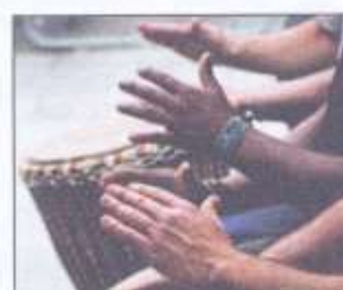
Die speel van die djembe -trom